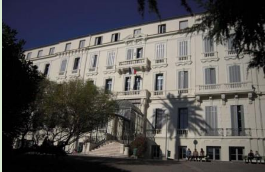
Lycée général et technologique de Bristol